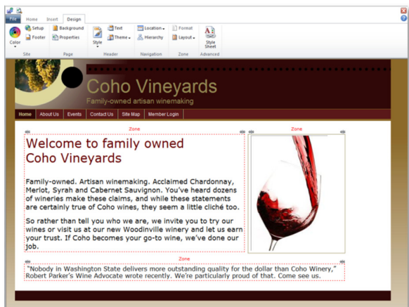
Ferramentas de desenho fáceis de utilizar baseadas na Web